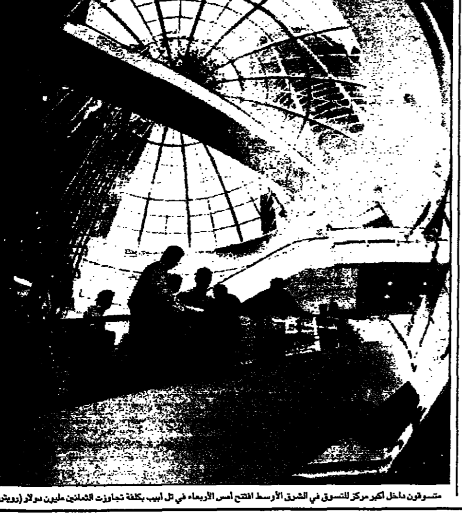
مشرفون داخل مركز التسوق في الشرق الأوسط المتاح أسس الاربعاء في تل أبيب بكلفة تجاوزت المائتين مليون دولار

بيروت - في بيان أعلن وزير الدولة للشؤون المالية فؤاد السنيورة عن رفع قيمة اصدار سندات الخزانة الاجنبية (يوروبوند) من 800 مليون دولار الى مليار دولار. وقال السنيورة إن هذا الارتفاع جاء بسبب الطلب الكبير على السندات اللبنانية في السوق الأوروبية.